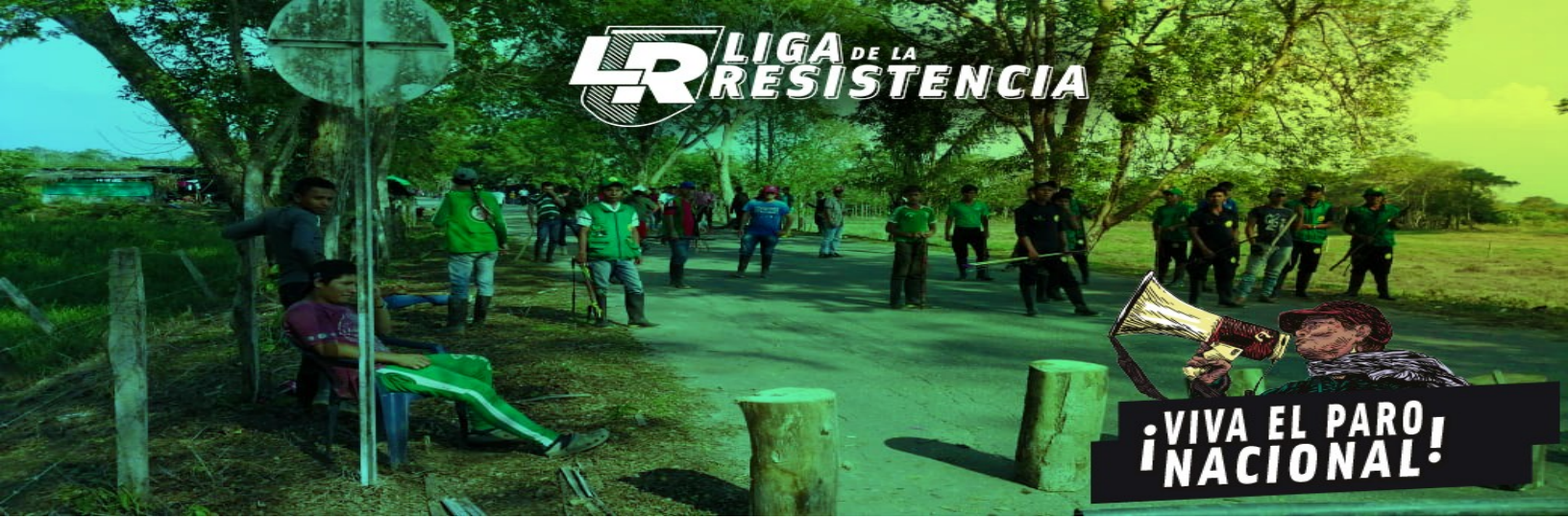
Grupo No. 2. En proximidades de la Y Astilleros, aproximadamente a tres kilómetros (Carretera Tibú-Cúcuta) Entre la 1:00 y las 2:00pm militares y policías detienen la caravana e impiden el paso de la movilización.